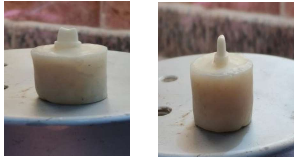
الشكل رقم (1): صورة للسن يعد التحضير

وجرى تحضير الضاحك الأول العلوي لاستقبال تاج خزفي كامل وفقاً لأصول التحضير الأكاديمي، مع خط إنهاء على شكل شبه كتف عميق (Deep chamfer) بعرض 1 ملم وسماكة تحضير للجدران المحورية 1.5 ملم كما في الشكل (1).