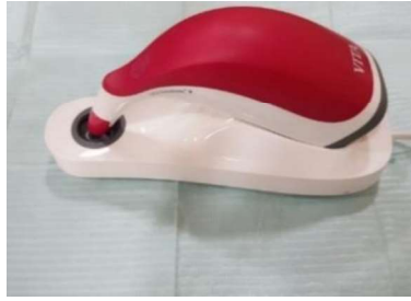
الشكل رقم (4): جهاز تحديد اللون Vita Easyshade® V

أجريت القياسات اللونية لعينة البحث بواسطة جهاز قياس الطيف الضوئي Vita Easyshade® V من شركة VITA الألمانية لمعرفة مقدار التغي اللوني الذي سيطراً على عينة البحث في المرحلة اللاحقة بعد الغمر الشكل (4)، حيث تم تطبيق العينات على الدعامة الأساسية التي تم تحضيرها (لتحاكي الحالة السريرية وتمثل خلفية بيضاء تحت العينات) (Koishi,2001)، ومن ثم ترطيبها بواسطة قطنة مبللة، لتبدأ عملية القياس لعينات التعويض المؤقت، حيث تم أخذ القياسات اللونية عند نقطة مرجعية على السطح الدهليزي (في الثلث المتوسط) حسب تعليمات الشركة المصنعة ومعايير اختيار اللون حسب (السلطان،2008)، الشكل (5).