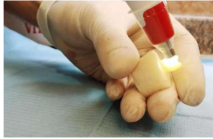
الشكل رقم (5): قياس اللون بنقطة مرجعية (الثلث المتوسط)