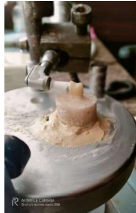
الشكل رقم (3): عملية التلميع التيجان المؤقتة

بعد القيام بإنهاء عينة البحث تمّ تلميع المجموعة الأولى بواسطة معجون الماس، بينما لمعت المجموعة الثانية باستخدام معجون أكسيد الألمنيوم، حيث استخدم لهذه المرحلة قمع مطاطي على قبضة مكرتور معوجة (nsk,Japan) موصولة بالمكرتور المستخدم في المرحلة السابقة حيث تم تركيبها على جهاز التخطيط بهدف توحيد المسافة والضغط المطبق بين العينات والأداة الحاملة لمادة التلميع (قمع التلميع) حيث تثبت القاعدة الإكريلية للضاحك بالجبس ووضعت العينات التي سيتم تلميعها عليه دون إصاق وذلك لتجنب لحدوث أي تغيير في موضع التيجان اثناء عملية التلميع ( Alawjali, 2013) الشكل(3)، ثم تم تطبيق معاجين التلميع على العينات المدروسة بعد ترطيب سطحها بالماء، بحيث يكون قمع التلميع على ملابس لسطح العينة (Yolanda et al, 2017)، وجرى تلميع كل عينة لمدة 30 ثانية الشكل(3)