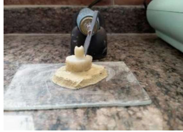
الشكل رقم(2): عملية إنهاء التيجان المؤقتة

تمّ إنهاء العينات بواسطة ورق صنفرة من كربيد السيليكون ذات قياس حبيبات (P1000) من شركة (AOT, Tiland) طبقت من خلال حامل رُكب على قبضة مكرتور مستقيمة موصولة بمكرتور من شركة (M&F, Australia) بسرعة دوران منخفضة لمدة 10 ثوان. (Yildiz, 2015; Karaarslan, 2013; Guler,2005) حيث تم وضع العينات على السن المحضر بعد تثبيت قاعدته الإكريلية بالجبس منعاً لحدوث أي تغيير في موضع التيجان اثناء الإنهاء مع التبديل المتكرر لورق السحل بعد إنهاء كل تاجين، الشكل(2)