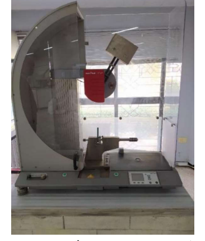
الشكل رقم (3): اختبار مقاومة الصدم