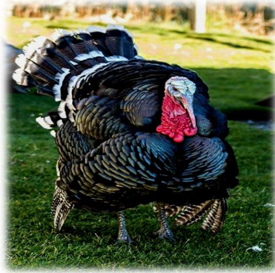
البرونزي عريض الصدر