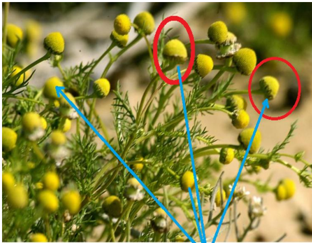
بابونج - النورة مركبة من أزهار انبوية فقط

الانتشار: عشب حولي عطري شتوي، موطنه الأصلي جنوب أوروبا وشرقها. وينتشر في اغلب المناطق الداخلية في سوريا. يضم أنواع كثيرة: الحولي الألماني - البابونج البلدي - البابونج الروماني. الجزء المستعمل طبيًا: النورات الزهرية التي تُجمع قبل تمام التفتح مع جزء من الساق.