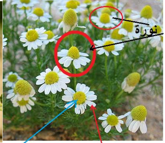
ازهار لسانية بيضاء وازهار انبوية صفراء